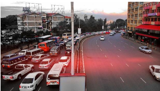
Trafik i Nairobi, Kenya

3) Kenya. NTU skal i Kenya hjælpe myndighederne med at forbedre ledelse, planlægning og tekniske kompetencer inden for landets transport og byudvikling. Formålet er bl.a. at udvikle et mere effektivt og sikkert transport- og byplanlægningssystem, som vil sikre bæredygtighed i byudvikling og mobilitet. Disse effektiviseringer skal desuden hjælpe med at omdanne hovedstaden Nairobi mere i retning som smart city med bæredygtige mobilitetsplaner, hvor viden og teknologi bidrager til positiv byudvikling med formindsket belastning på lokalmiljø og klima til følge.