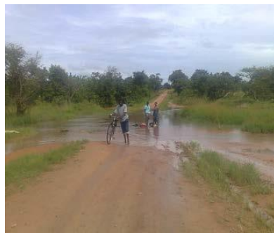
Klimaudfordringer i Zambia

3) Kenya. NTU skal i Kenya hjælpe myndighederne med at forbedre ledelse, planlægning og tekniske kompetencer inden for landets transport og byudvikling. Formålet er bl.a. at udvikle et mere effektivt og sikkert transport- og byplanlægningssystem, som vil sikre bæredygtighed i byudvikling og mobilitet. Disse effektiviseringer skal desuden hjælpe med at omdanne hovedstaden Nairobi mere i retning som smart city med bæredygtige mobilitetsplaner, hvor viden og teknologi bidrager til positiv byudvikling med formindsket belastning på lokalmiljø og klima til følge.