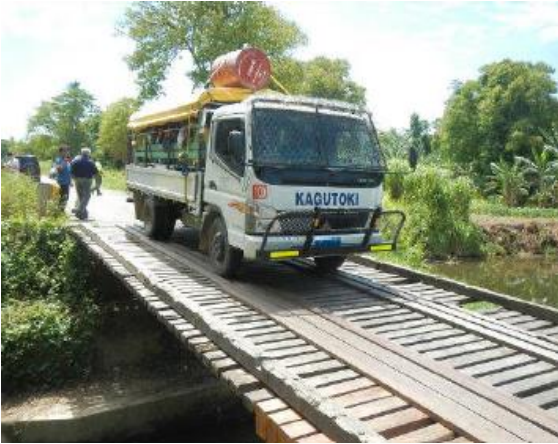
Lokal bro, Papua Ny Guinea

4) Papua Ny Guinea. NTU skal udføre omfattende planlægning i forbindelse med fjernelsen af flere af landets gamle og usikre broer, som i stedet skal erstattes af 27 nye broforbindelser. Landets befolkning er på mange måder udfordret af ørigets bjergrige og farlige terræn, hvilket især gør sig gældende for planlægning af veje og vejtransport. Disse tiltag vil ikke blot forbedre den nationale infrastruktur, men vil også højne landets trafiksikkerhed.