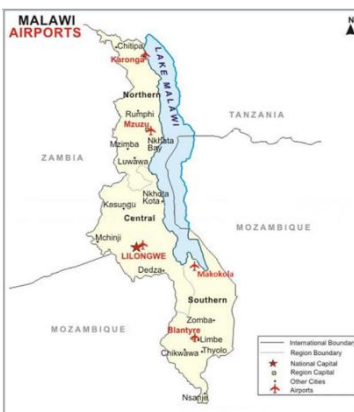
Kort over lufthavne i Malawi

1) Malawi. Flere af Malawis lufthavne har i høj grad brug for udvikling og opgradering. NTU vil her lede moderniseringen af de internationale lufthavne i Lilongwe og Blantyre. NTU skal forberede detailprojekter, overvåge implementering og evaluere på vegne af lufthavnene og luftfartsmyndighederne.